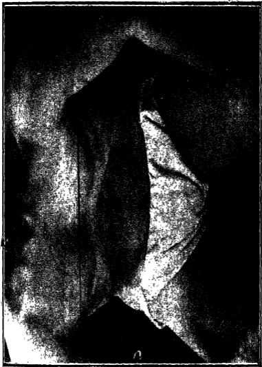
अखिल ( अने अक्षर )